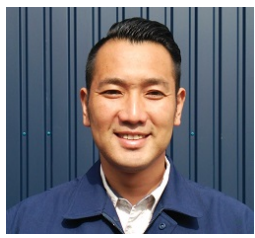
マイブームは「自家製燻製」